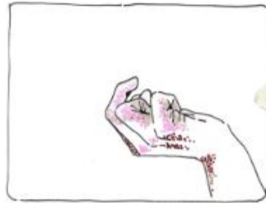
8. Dedos haciendo movimiento de llamada

La pression et la stimulation continuelle de la prostate, d'abord doucement, puis un peu plus fort en augmentant la vitesse, remplit la prostate du précieux liquide et au moment du climax il se produit une sorte de sensation, que nous avons sûrement déjà ressenti, qui ressemble à une envie soudaine de faire pipi. A cet instant précis il faut lâcher prise et pousser, donner ainsi libre cours à l'eau pour jaillir ! L'éjaculation peut être accompagnée d'un intense orgasme ou au moins d'une sensation très plaisante. Toute la "difficulté" de l'éjaculation réside dans le laisser aller et le fait de passer outre l'impression d'uriner, de ne pas nous arrêter à ce point et d'expulser le liquide. Il ne s'agit pas d'urine ! et une fois qu'on l'a ressenti une première fois on constate que ni le liquide expulsé, ni la sensation et ni la forme de l'expulsion de ce liquide ressemblent à celui de l'urine. Évidemment, la proximité de la prostate avec l'urètre et avec les canaux para-urétraux peuvent produire des sensations semblables mais qu'on peut facilement reconnaître avec la pratique.