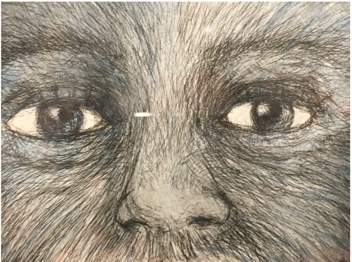
WOLF GIRL eau-forte, aquatinte et pointe sèche, 1999 (détail)

Smith signalent la fin du vivant, l'heure de la décomposition et du retour à la terre. Cette vision particulière de la fin et de la finitude se donne à éprouver de multiples façons. Des êtres infimes tombent dans le vide, flottent en état de grâce, perdent des plumes et des écailles ; une mue de serpent reste en suspens, des fleurs se tassent, se fanent, rongées par le temps, pourrissantes, pour revenir à la terre. Les œuvres de l'artiste sont pleines d'un futur absent : ce retour à la terre annonce qu'elle sera nourrie, qu'il y a un cycle cosmique qui dépasse et absorbe le vivant, mais ce futur n'est pas représenté. C'est une forme de présence de l'absence dans la décomposition. Le moment du pourrissement est un moment de nourrissage.