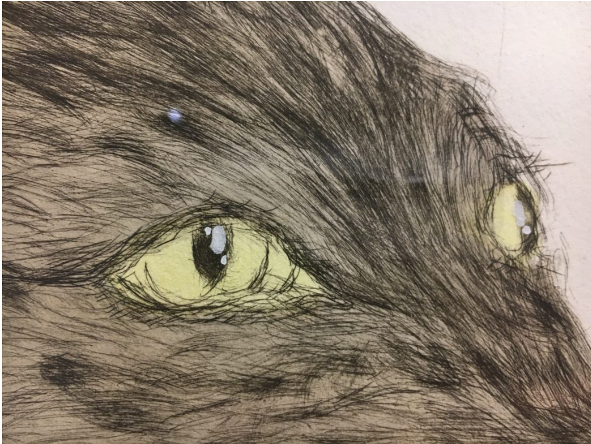
SPLENDID eau-forte sur papier japonais, 2002 (détail)

lignes de démarcation s'estompent, la vue n'a plus l'exactitude habituelle du jour.